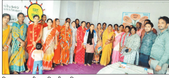
बिहान समूह की एक दिवसीय प्रशिक्षण।

विशेष पहाड़ी कोरवाओं के आर्थिक स्थिति में सुधार करने साथ में प्राकृतिक संसाधनों को संरक्षित रखते हुए आजीविका एवं लाभ प्राप्त करने हेतु उपायों पर चर्चा किया गया। प्रशिक्षण में बताया गया कि बिहान और वन