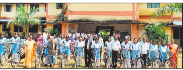
छात्राओं को सायकल वितरण करते स्कूल के प्राचार्य।

परिस्थितियों में साथ देगा। सायकल मिलने से अब आप लोगों को विद्यालय नियमित आने में, पढ़ाई जारी रखने में सहायक होगा। मुझे विश्वास है कि आप सभी अच्छा पढ़ कर विद्यालय और अपने गांवों का गौरव बढ़ाएंगे। विद्यालय में