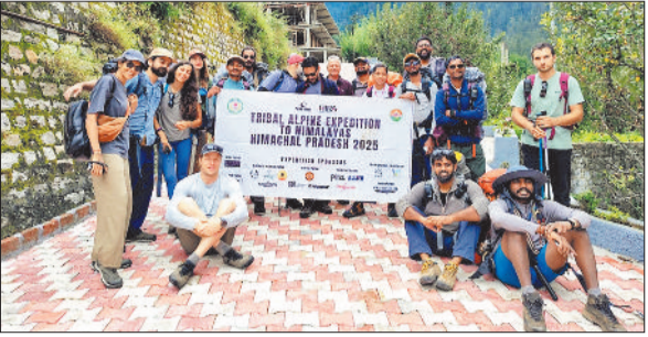
हिमालय की ओर रवाना जनजातीय पर्वतारोहण टीम।