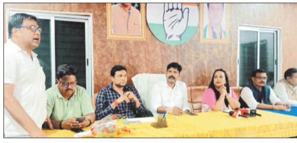
प्रेसवार्ता करते कांग्रेसी।

इस दर्दनाक हादसे में तीन लोगों की मौत और 22 श्रद्धालु गंभीर रूप से घायल हुए। घटना के बाद पीड़ित परिवारों ने सड़क पर ही शव रखकर न्याय और उचित मुआवजे की मांग की। लेकिन प्रशासनिक अमला घंटों तक मौके पर नदारद रहा। कांग्रेस नेताओं ने इसे प्रशासन की "संवेदनहीनता और जनविरोधी नीति" करार