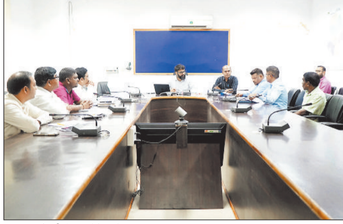
अधिकारियों की बैठक लेते कलेक्टर।

पंजी में श्रमिक का नाम, दूरभाष नं., गंतव्य पूर्ण पता, नियोक्ता की जानकारी दर्ज अवश्य करवाने को कहा। उन्होंने लीड बैंक मैनेजर को जिले में वित्तीय समावेशन को तीव्र गति से संचालित करते हुए प्रत्येक ग्राम के शत प्रतिशत को बैंकिंग सेवाओं से लाभान्वित करने के निर्देश दिए। उन्होंने नए बैंकों की शाखाओं को खोलने के लिए ऐसे ग्राम जहां आस पास बैंक नहीं है उन्हें चिन्हित करने को कहा। उन्होंने एटीएम,