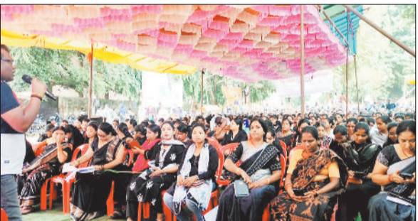
धरना स्थल पर काला पोशाक पहनकर पहुंचे एनएचएम कर्मी।