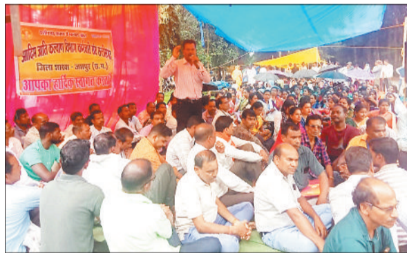
धरना प्रदर्शन करते कर्मचारी।

लंबे समय से शासन-प्रशासन के दरवाजे खटखटाने के बावजूद जब उनकी जायज मांगों को सौंपे टोस कार्यवाही नहीं हुई, तो सैकड़ों कर्मचारी एकजुट होकर कामकाज ठप कर आंदोलन पर बैठ गए। कर्मचारियों ने कलेक्टर को सौंपे गए ज्ञापन में स्पष्ट किया था कि वर्ष 1996 और 1999 के शासनादेशों तथा 2012 शेष पेज 4 पर